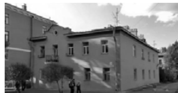
Дом в котором «Маленький мальчик» начал свое восхождение к успеху (ныне снесен)

Воодушевившись творчеством группы «The Beatles», летом 1977 года в Старой деревне у Приморского шоссе студенты образовали