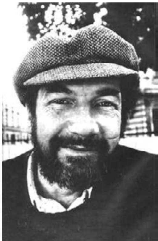
Петербургский поэт Олег Григорьев

в народе как часть знаменитого цикла садистских куплетов, например: